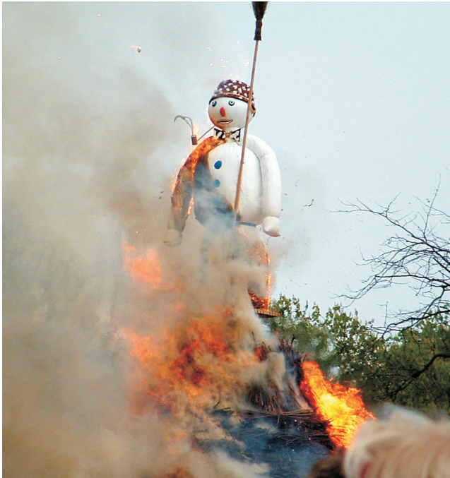
Die Verbrennung des Böögg gehört zu den Höhepunkten des Sechseläuten-Frühlingsfestes in Zürich. Je schneller der mit Feuerwerkskörpern gefüllte Kopf explodiert, desto schöner soll der anschließende Sommer in der Schweiz werden.

Wetters in der Schweiz geben können, dafür aber Parallelen mit Entwicklungen im globalen Klimasystem zeigen! Der Artikel ist bezeichnenderweise am 1. April erschienen und verdeutlicht auf amüsante Art und Weise den motivgeleiteten Ansatz, zwei zufällige parallele Entwicklungen in einen kausalen Zusammenhang zu bringen.