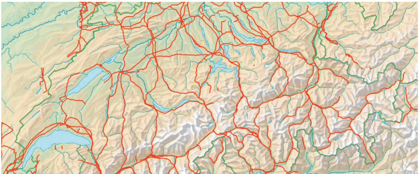
Hochspannungsleitungen VECTOR25 und Hintergrundkarte

Eine Schweizer Machbarkeits- und Pilotstudie